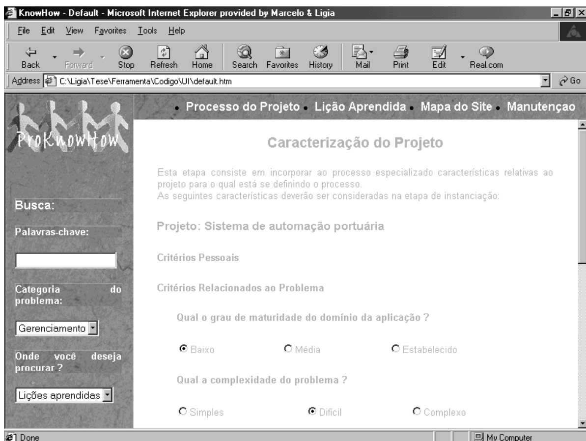
Figura 3 – Caracterização do projeto

Na definição de um processo de software para um projeto, deve-se considerar a seleção de um modelo de ciclo de vida. São inúmeros os modelos de ciclo de vida propostos na literatura e uma seleção inadequada pode influenciar no sucesso de um projeto. Neste trabalho, foram considerados apenas os modelos de ciclo de vida aprovados para uso no CDSV, sendo que, para a seleção, utilizou-se a sistemática definida em [5].