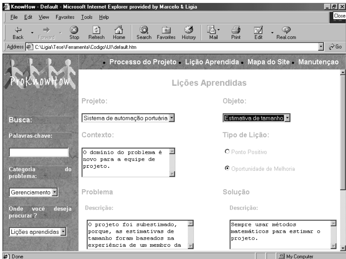
Figura 4 – Cadastro de lições aprendidas